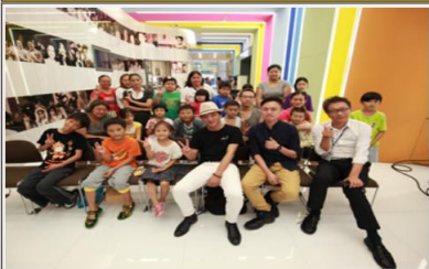
中視愛心基金會舉辦南港社區家庭日活動 與南港家扶中心共度溫馨親子日(106/9/27)

中視愛心基金會舉辦南港社區家庭日活動 邀請家扶中心親子家庭觀賞<TMD天堂>影片欣賞會，共度溫馨家庭日