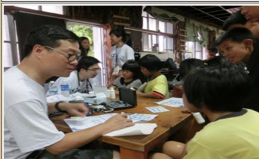
台灣大學醫學院醫學系師生暑期台東服務團

中視愛心基金會為關懷偏鄉地區學童及鄉民醫療保健與健康管理，與台灣大學醫學系及中國醫藥大學牙醫系辦理「偏鄉服務 健康照護」專案