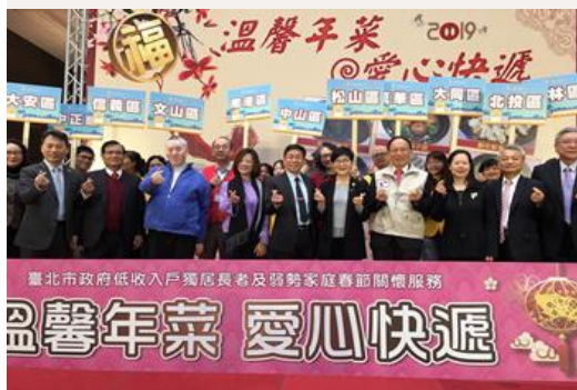
108 年溫馨年菜愛心快遞 中視愛心基金會關懷獨居長輩 (108/01/31)