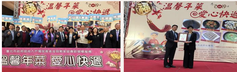
108 年捐出 10 台車(108/10/31)

中視愛心基金會與旺旺集團董事長蔡衍明在中視 50 週年台慶當天，聯合送出 7 台復康巴士、3 部愛心物資運輸車。(影音)