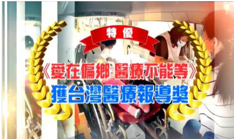
<愛在偏鄉 醫療不能等> 2020台灣醫療報導獎