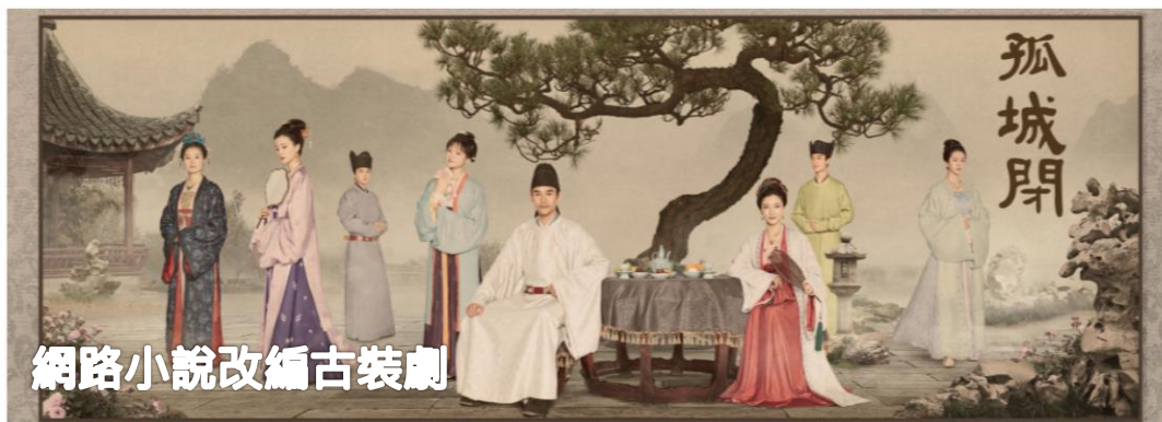
網路小說改編古裝劇