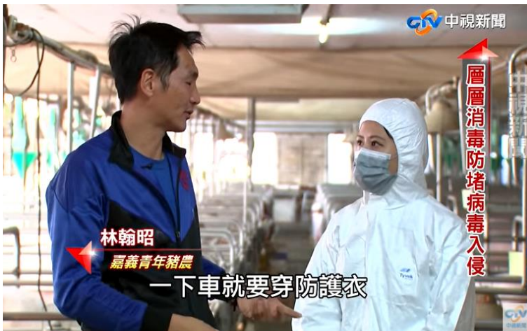
<解碼豬瘟 防疫大作戰> 入圍2019年現代財經新聞獎